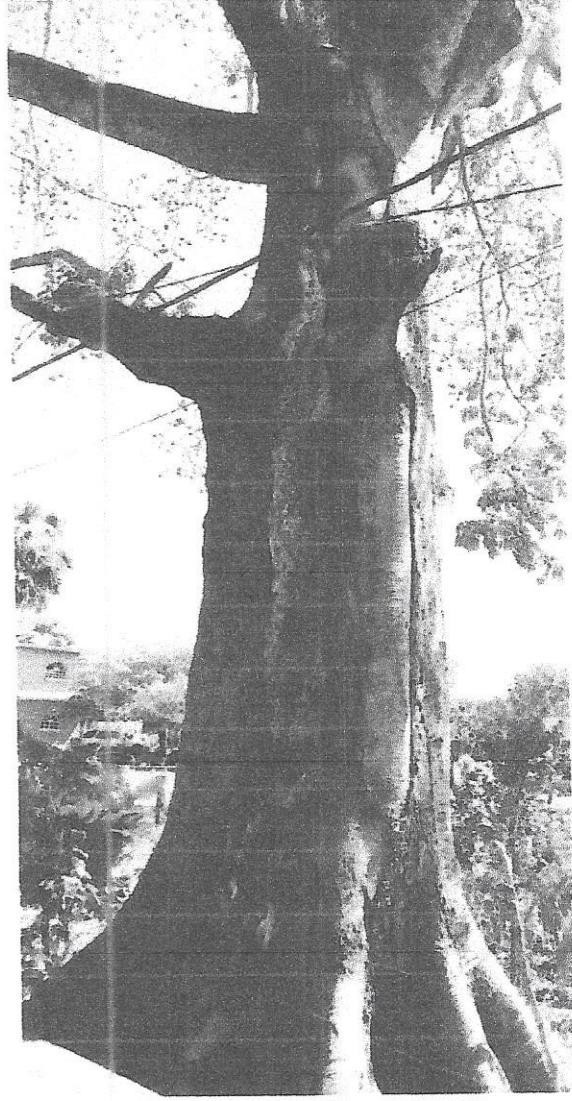
Imagen.- Ceiba ( Ceiba pentandra ) presenta un estado fitosanitario deteriorado; con presencia de insectos barrenadores de la madera del orden Coleoptera en el tronco y ramas. El tronco está totalmente dañado, con múltiples perforaciones y orificios provocado por los barrenadores, este daño está presente en toda la parte interna de la ceiba, haciendo que sea prácticamente irrecuperable el ejemplar